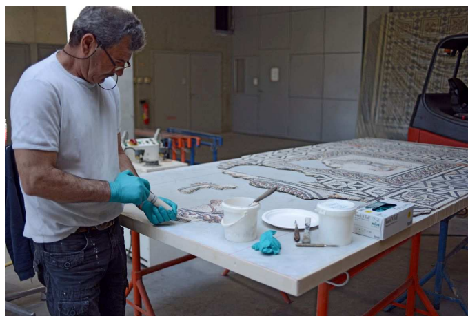
Restauration d'une mosaïque

Atelier de restauration de Saint-Romain-En-Gal