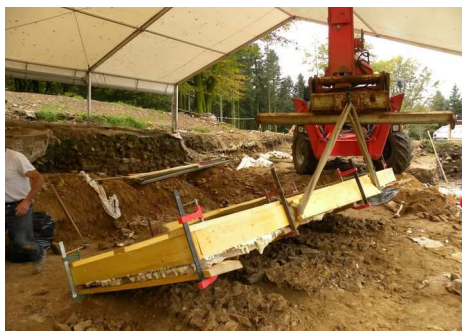
Soulèvement par une machine