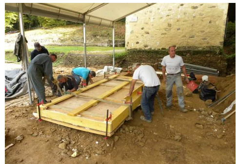
Préparation du coffrage et passage des lames métalliques dans le mortier antique