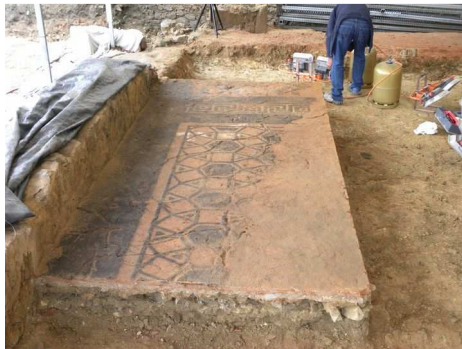
Dégagement de la mosaïque

Cette opération est réalisée quand l'état de dégradation des pavements ne permet pas leur maintien sur le support originel, ou pour permettre la fouille de niveaux plus profonds. Le principe consiste à séparer le tesselatum * de son support, (après l'avoir entoilé afin d'assurer sa cohésion). Le prélèvement s'effectue en découpant la surface en panneaux transportables, selon la composition du décor. Pour dissocier la mosaïque de son support, on glisse généralement de longues lames métalliques entre les couches de mortier. Les éléments de mosaïque ainsi désolidarisés sont ensuite retournés sur des panneaux de contreplaqué qui permettent leur transport, puis leur stockage avant l'engagement de la restauration.