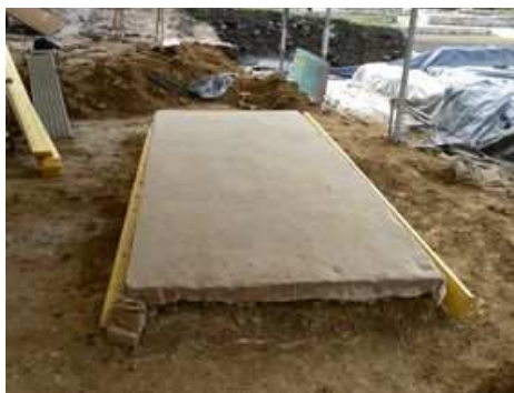
Deuxième entoilage avec de la toile de jute