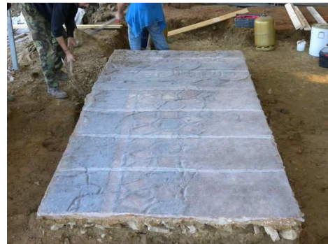
Premier entoilage avec de la gaze