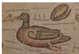
Un canard et coquillage