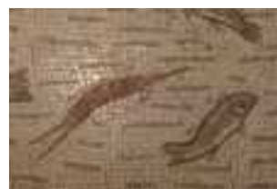
Une crevette et poisson