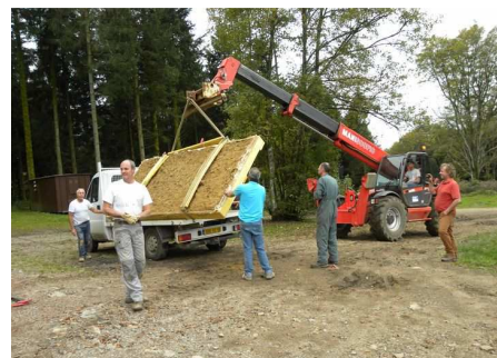
Transport sur une camionnette et direction l'atelier de restauration