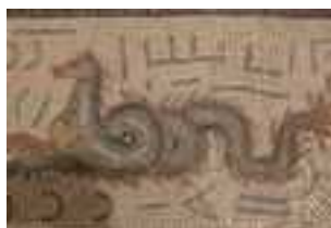
Un monstre marin