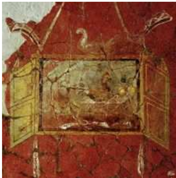
Détail de la peinture aux Xénia

Ce panneau est daté par les données archéologiques, de la seconde moitié du I er siècle après J.-C., entre 50 et 70.