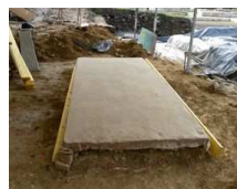
Entoilage à la toile de jute