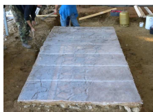
Entoilage à la gaze